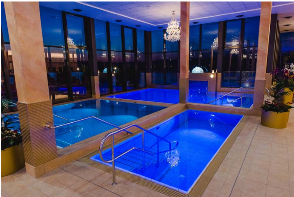
Bild 3 und 4: „König Ludwig II hätte seine helle Freude gehabt“, meint Günther Beckstein, früherer bayerischer Ministerpräsident und Aufsichtsratsvorsitzender der Kristall Bäder AG, zum neuen Kristallbad trimini. Erlebnisbad und Erweiterungsbau bieten Badespaß und

Sitz der Gesellschaft: PCI Augsburg GmbH Piccardstraße 11, 86159 Augsburg Postfach 10 22 47, 86012 Augsburg Tel. +49(8 21) 59 01-0 Fax +49(8 21) 59 01-372