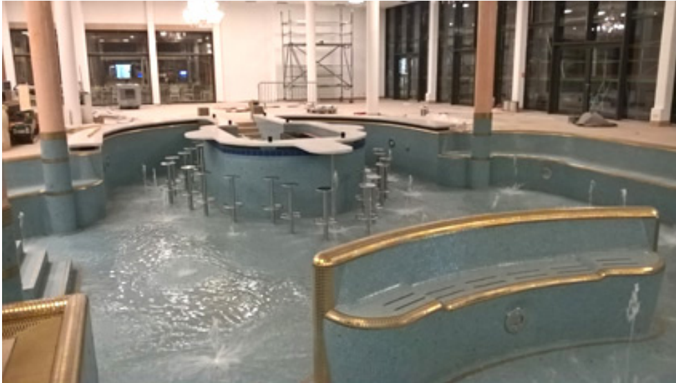
Bild 11: Das Wasser kann fließen: In der Poolbar ist der Fliesenbelag verlegt und verfugt. Der Untergrund ist dank PCI Seccoral 2K Rapid absolut dicht.

https://pics.pci-augsburg.com/php/index.php?database=1&downloadimage=55480&size=3264x1840&format=&time=1555538399&check=c09958ac631df4917b189e2a289dba74