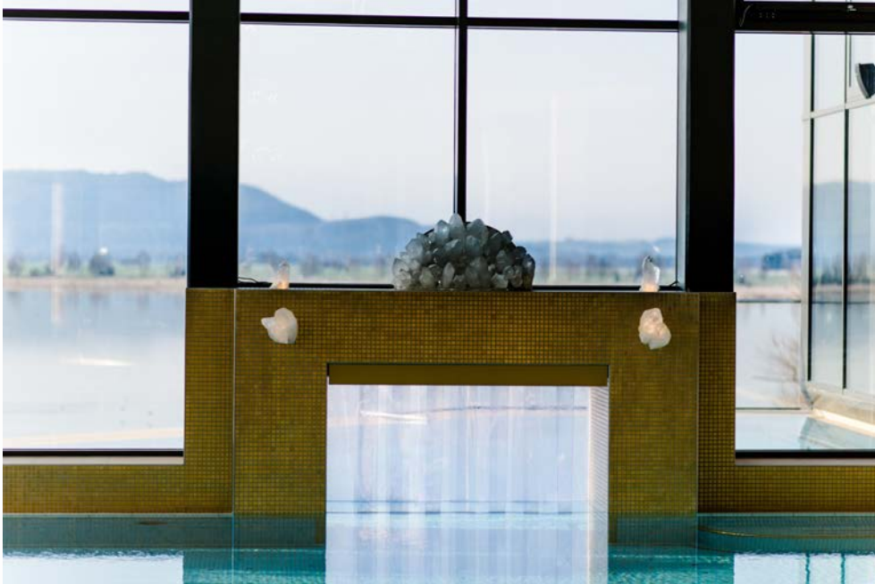
Bild 12: Die Umbau- und Erweiterungsarbeiten dauerten 21 Monate, im März 2017 wurde das Kristall trimini termingerech eröfnet – eine Hochglanz-Therme mit Ausstattung und Technik „vom Allerfeinsten“, so Günter Beckstein.

https://pics.pci-augsburg.com/php/index.php?database=1&downloadimage=55481&size=6387x4263&format=&time=1555538399&check=392609eb296f6e7b0ddfe97212d4646c