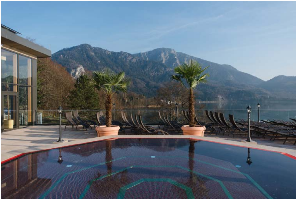
Bild 1: Die Kristall Bäder AG hat das Familienbad Trimini am Kochelsee saniert und um eine prunkvolle Wellness-Oase erweitert – mit PCI-Produkten bei Abdichtung und Fliesenverlegung.

https://pics.pci-augsburg.com/php/index.php?database=1&downloadimage=55468&size=1840x1228&format=&time=1555538399&check=598add4e5dc80c45a12f5e2406012886