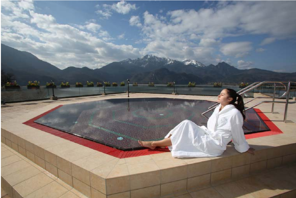
Bild 2: Sieben Saunen mit einer Gesamtfläche von 450 m 2 sind entstanden, die größte ist die Herzogstand-Sauna mit traumhaftem Blick auf die Natur und den gleichnamigen Berg.

https://pics.pci-augsburg.com/php/index.php?database=1&downloadimage=55469&size=2268x1512&format=&time=1555538399&check=f4b9996a2cd7776dd7e178db3f2f36fc