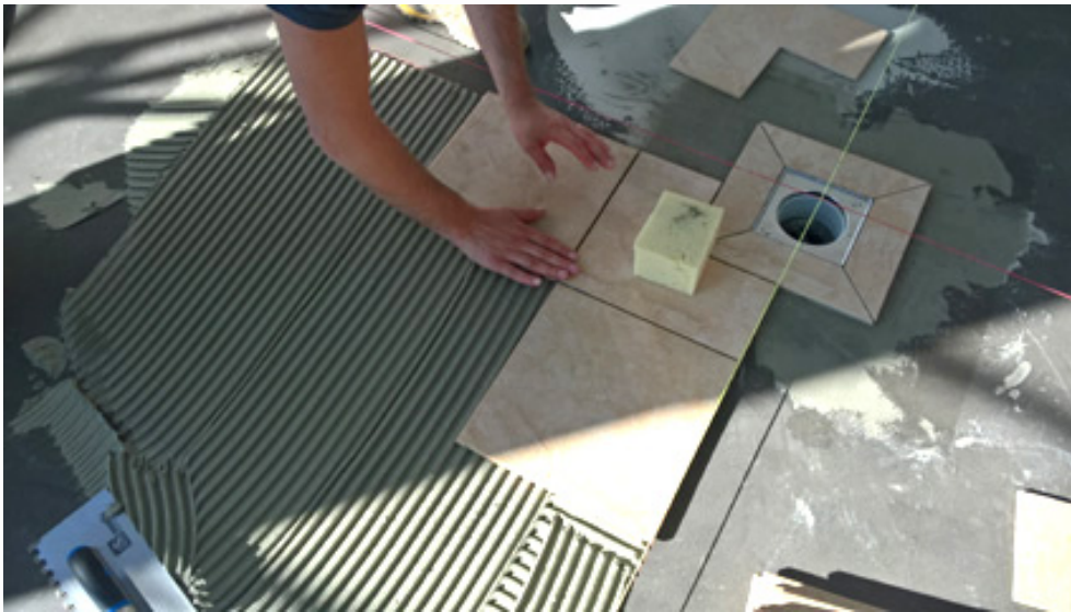
Bild 9: Das Verlegen der rutschhemmenden Fliesen im Umgangsbereich, in Duschen und Umkleiden erfolgte mit dem Dünnbettmörtel PCI FT Klebemörtel, dem der elastifizierende Zusatz PCI Lastoflex beigemischt wurde.

augsburg.com/php/index.php?database=1&downloadimage=55475&size=1600x1200&format=&time=1555538399&check=1dc5c3a4480e18f5803ba24987e7de52