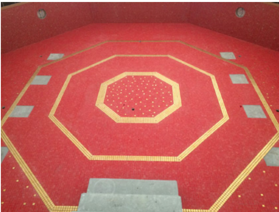
Bild 7 und 8: Exklusiv und edel wirken die mit Mosaik verlegten Becken in der Kristall-Therme trimini. Damit diese dauerhaft dicht sind, wurde die schnellabbindende Sicherheits-Dichtschlämme PCI Seccoral 2K Rapid verbaut.

Sitz der Gesellschaft: PCI Augsburg GmbH Piccardstraße 11, 86159 Augsburg Postfach 10 22 47, 86012 Augsburg Tel. +49(8 21) 59 01-0 Fax +49(8 21) 59 01-372