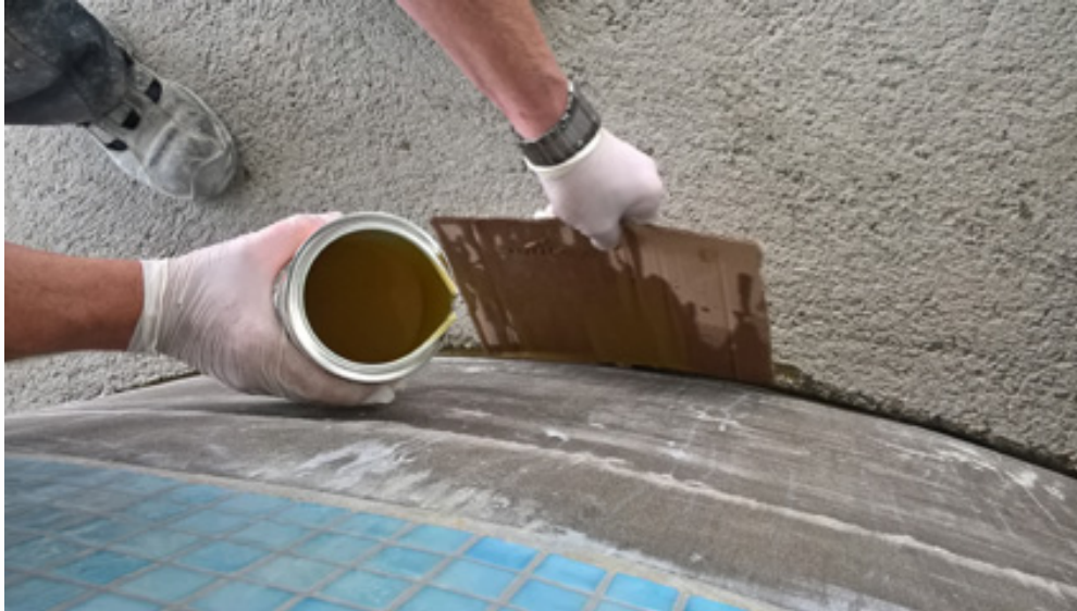
Bild 6: Elastischer Fugenverguss mit PCI Apogel E im Becken zwischen Estrich und aufgehender Wand.

https://pics.pci-augsburg.com/php/index.php?database=1&downloadimage=55473&size=3264x1840&format=&time=1555538399&check=de659bfacb409527618584f56bad0902