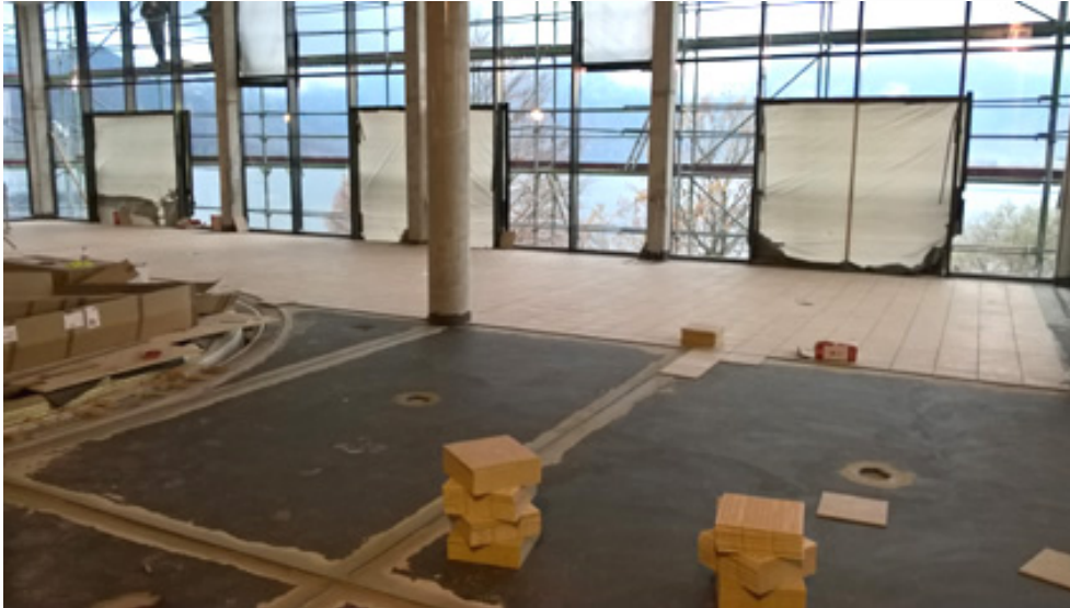
Bild 10: Verfugt wurde der Mosaikbelag im Becken mit PCI Durapox NT plus. Der Reaktionsharzmörtel eignet sich speziell für chemikalienbelastete Beläge, ist verschleißfest, widerstandsfähig und unempfindlich gegen Schwimmbad-Chemikalien. Für den Beckenumgang wurde der zementäre Spezial-Fugenmörtel PCI Durafug NT verwendet.

https://pics.pci-augsburg.com/php/index.php?database=1&downloadimage=55478&size=3264x1840&format=&time=1555538399&check=c08b0e5d00de3487b9968778bd0ebb7a