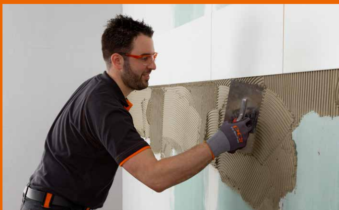
Lettfyllstoffene gjør påføringen så smidig og lett som aldri før.

PCI Nanolight er den universale stjernen i PCI-universet. En for alle underlag og alle keramiske belegg.