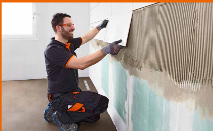
Pålegging på avslappet måte uten anstrengelser.